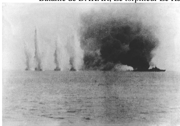
Le Hardi protège le Richelieu au moyen d'un rideau de fumée