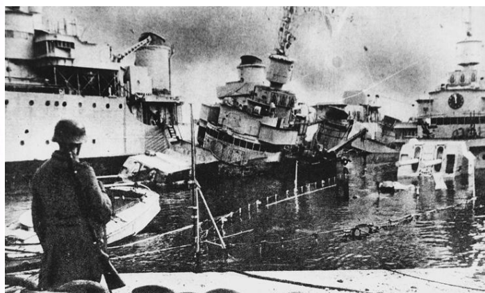
Le Hardi parmi les navires sabordés en Novembre 1942