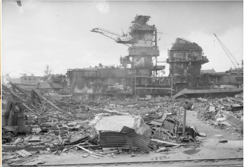
Chantier Naval de Kiel après le bombardement de juillet 44